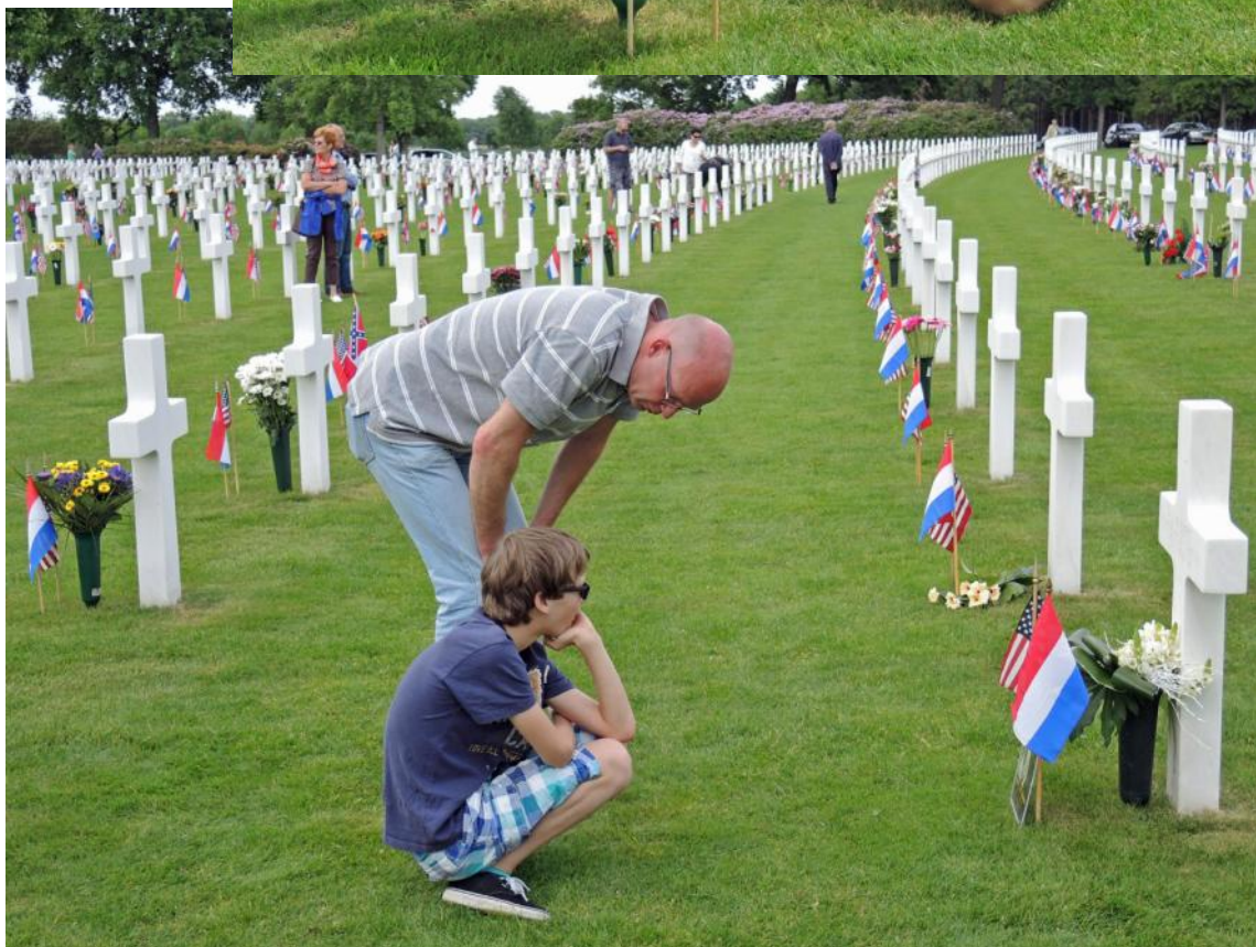
Memorial Day - Margraten Cemetery