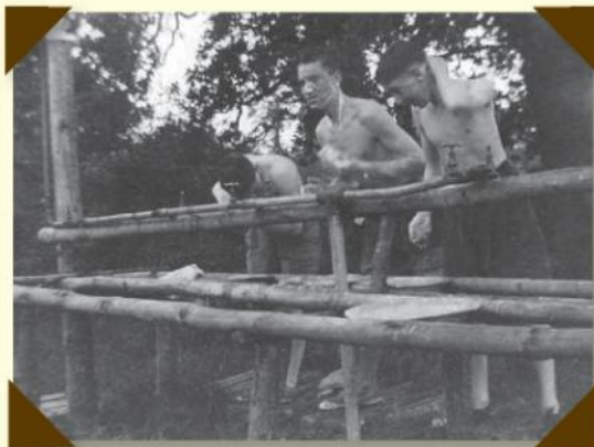
A cold wash, camping in 1936