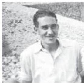
On the Isle of Wight, 1939