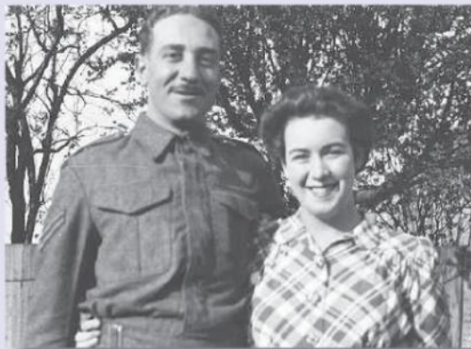
24th April 1942 at 30A Keswick Rd, Putney