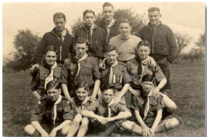
63rd Rovers and Scouts at Ashton, 3rd May 1936