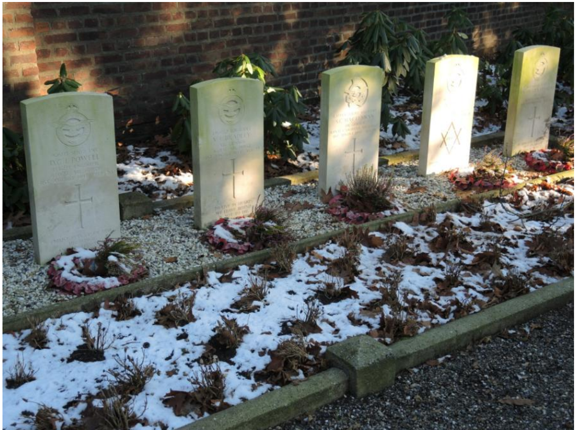
Roermond - Netherlands