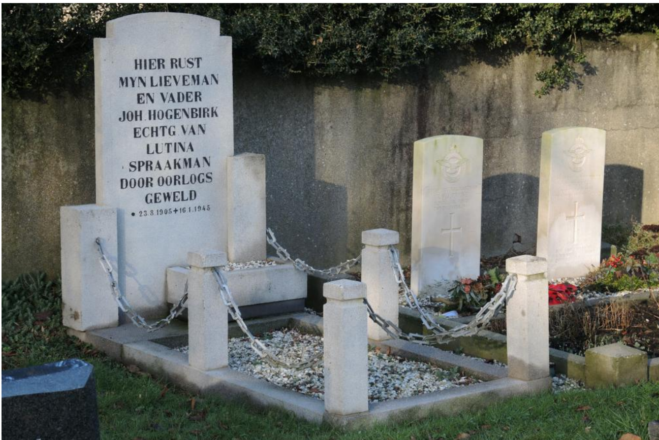
Grevenbicht - Netherlands