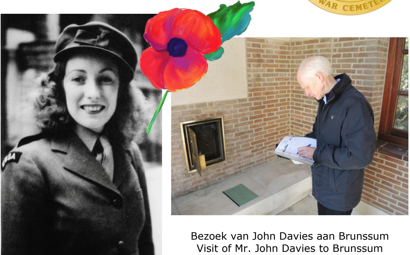
Bezoek aan Vera Lynn Visit to Dame Vera Lynn