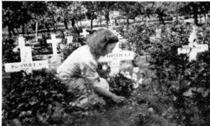
WYVERN CEMETERY, BRUNSSUM.

" In August, my husband and I visited Brunssum in Holland, where our son, who was killed while fighting with the 1st Bn. of the Worcestershire Regiment, is buried.