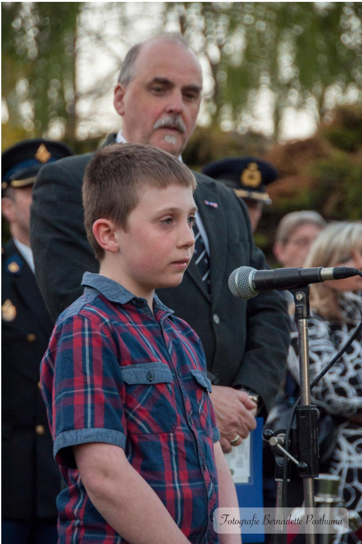
Fotografie Bernadette Posthuma