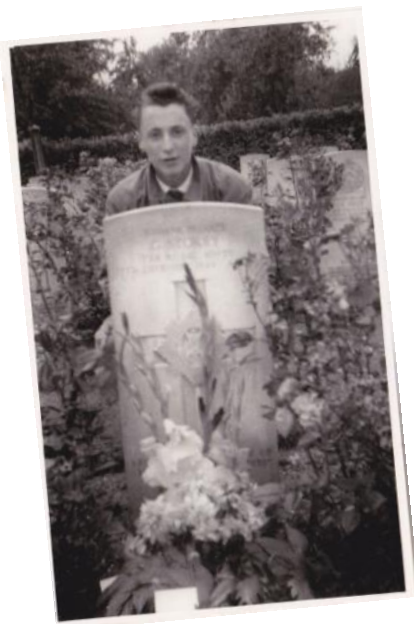
Foto editie omtrent de dodenherdenking op 4 mei 2016 te Brunssum. Photo edition regarding the commemoration on May 4 2016 in Brunssum.