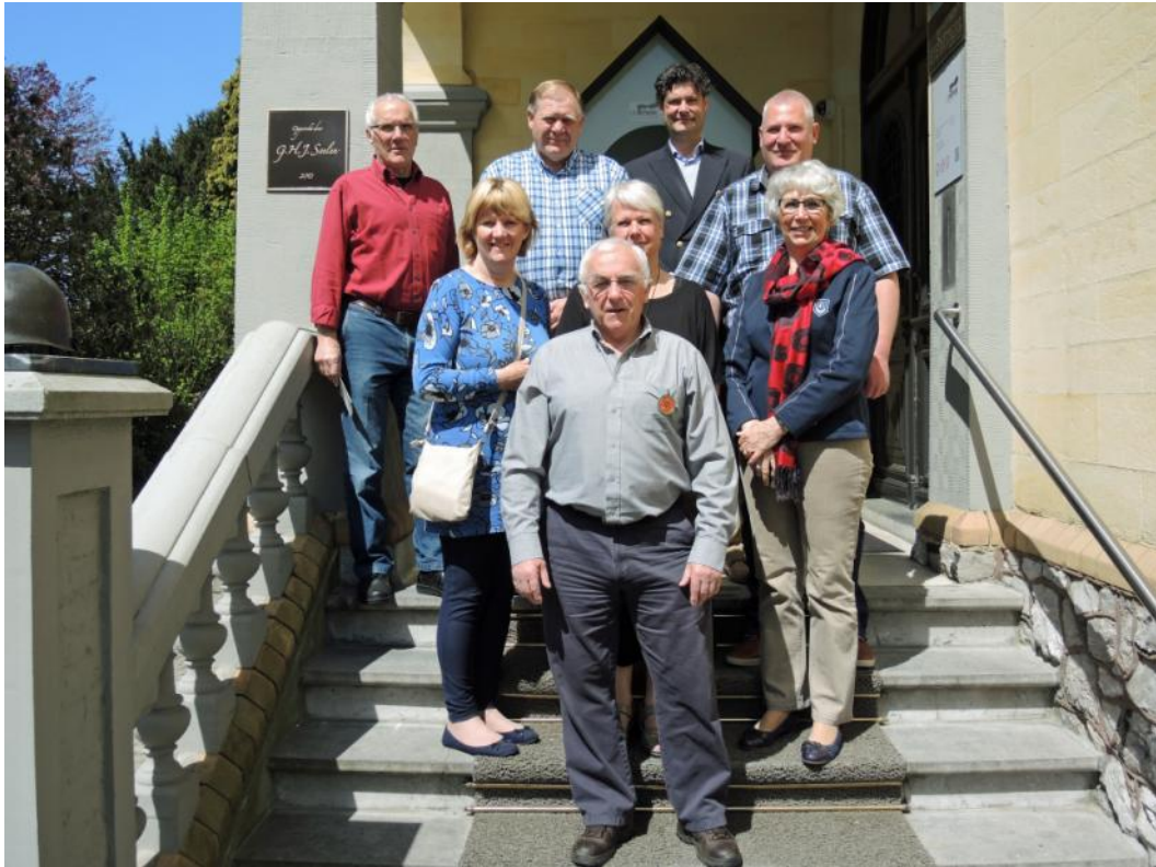
Dagje uit met enkele familieleden