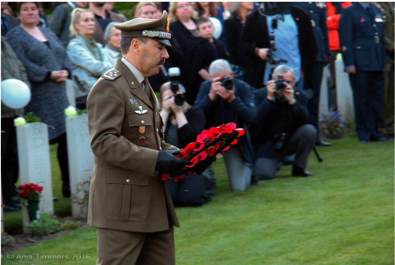
Wreath laying by General Farina at Brunssum War Cemetery