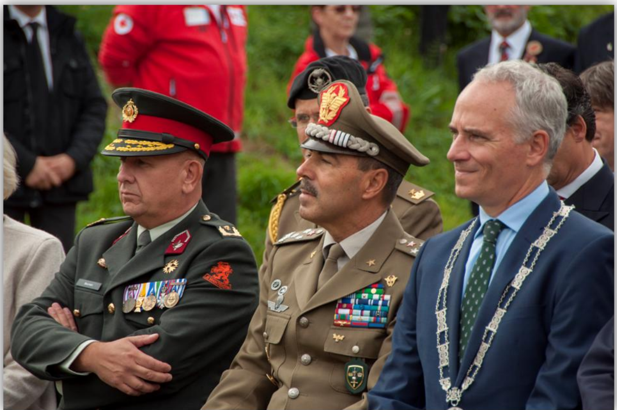
General Bouman (Dutch Armed Forces), General Salvatore Farina (Commander JFC Brunssum) and Mayor Luc Winants (Brunssum Mayor)