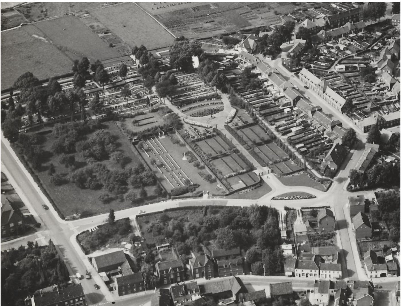
Luchtfoto Brunssum War Cemetery 1960

Aerial view Brunssum War Cemetery 1960, right next to the general cemetery